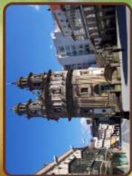
Iglesia La Peregrina/Church