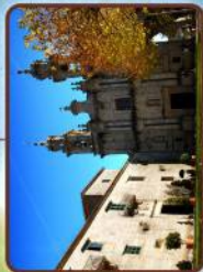
Monasterio de Poio/Monastery