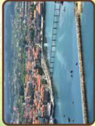
Puente Vilanova / Bridge

3 28 km Vilanova de Arousa / Pontecesures