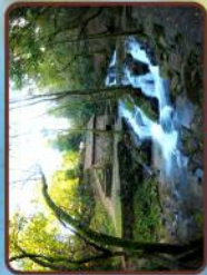
Ruta da Pedra e da Auga

3 28 km Vilanova de Arousa / Pontecesures