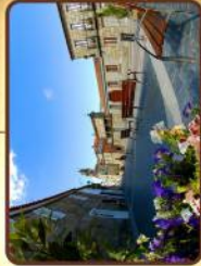
Vilanova de Arousa