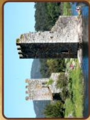
Torres de Oeste (Catoira)